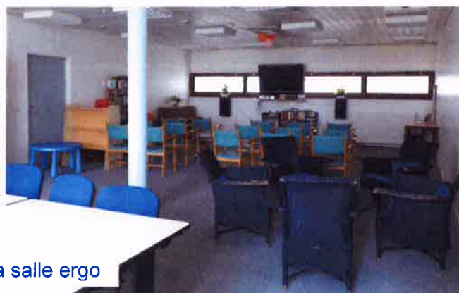
La salle ergo