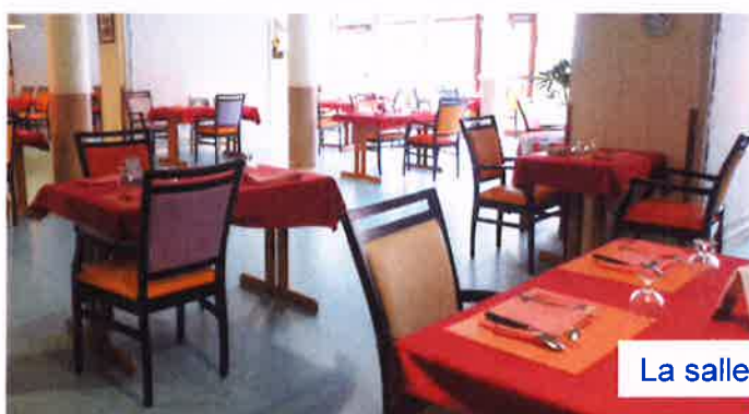
La salle de restaurant